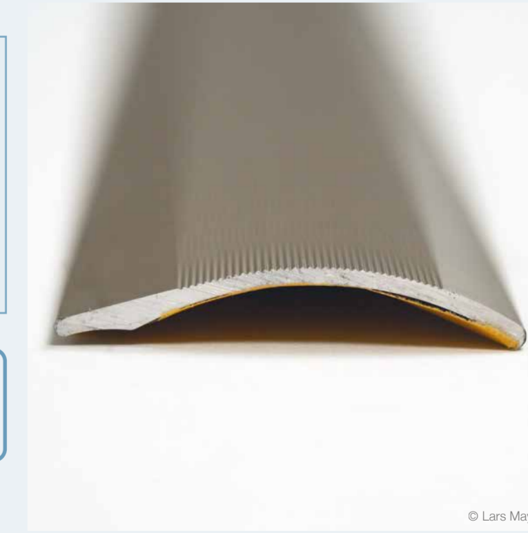
Teppichschiene // Carpet rail