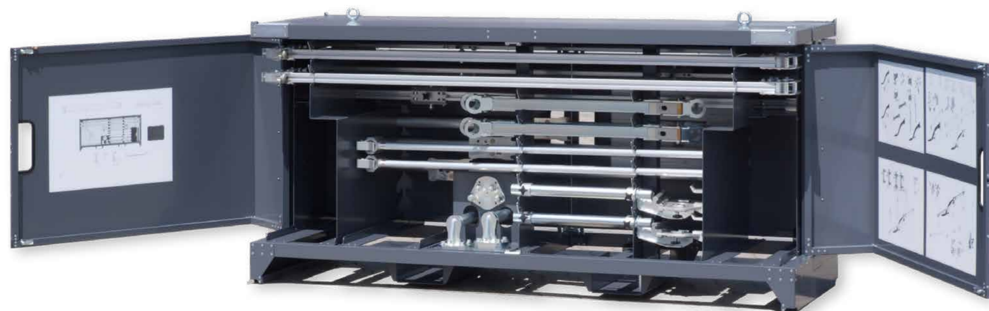
Produktionsbeispiel Komplettfertigung Bauteilgruppe // Complete production example of a full component group