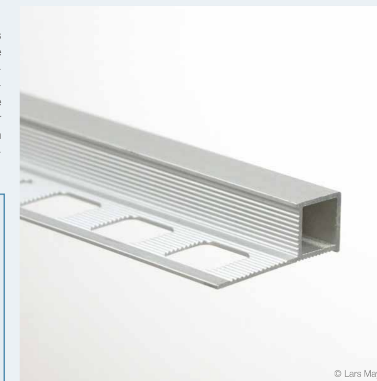
Fliesenschiene (Quadro) // Tile rail (Quadro)