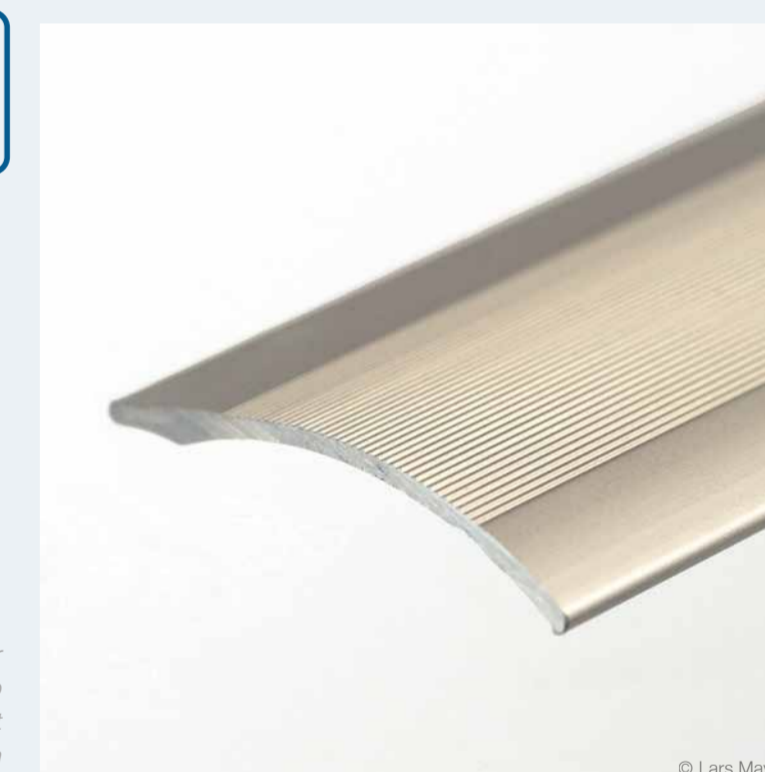
Teppichschiene // Carpet rail